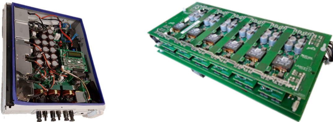
Fig.2 Comparaison de deux convertisseurs aux fonctionnalités proches, l'un traditionnel, l'autre, fortement modulaire et standardisé.

Il s'agira ensuite de proposer des solutions pratiques pour générer des inventaires du cycle de vie, et pour tester les effets de ces scénarios de process industriels « en pratique ».